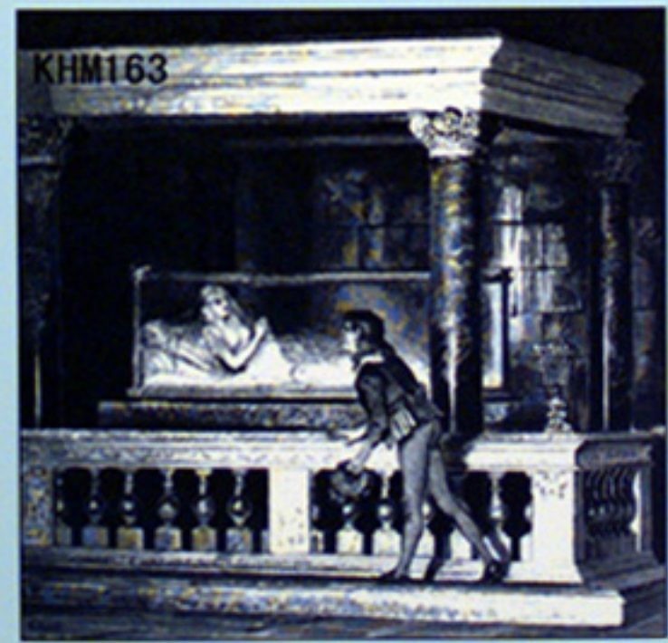
金のかぎ Der goldene Schlüssel