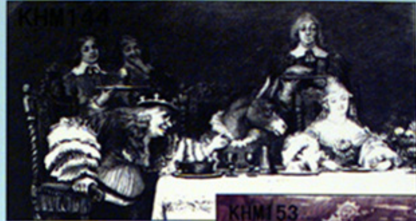
山男 Der wilde Mann