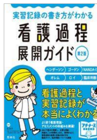
看護過程展開ガイド：実習記録の書き方がわかる