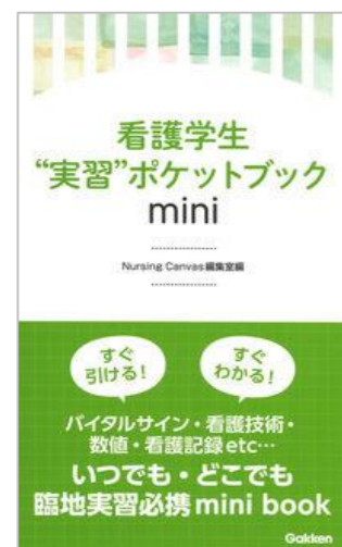
看護学生“実習”ポケットブックmini