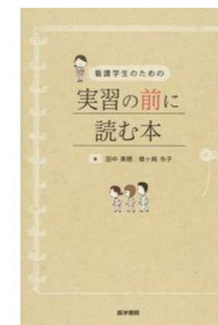
看護学生のための実習の前に読む本