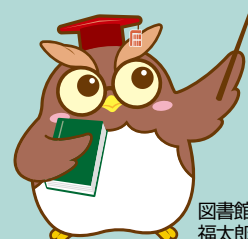
図書館キャラクター 福太郎先生