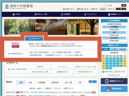
図書館ウェブサイト トップページ

図書館ウェブサイトのトップページ(MyLibraryタブ)や、蔵書検索(OPAC)画面からアクセスできます。福大IDでログインします。